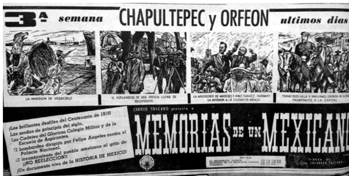
Cartel publicitario publicado en Novedades , 10 de septiembre de 1950, segunda sección, p. 4.

hora actual proviene de los hechos que son materia de esta película tan interesante [...] somos parte de la historia de México, efímeras gotas en el torrente de la vida nacional que encierra impulsos llamados a cuajar en frutos perdurables. 45