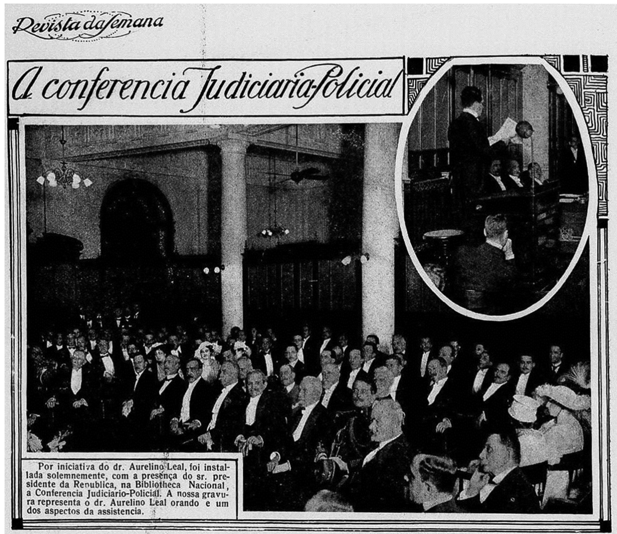
Foto da abertura da Conferência Judiciária-Policial.