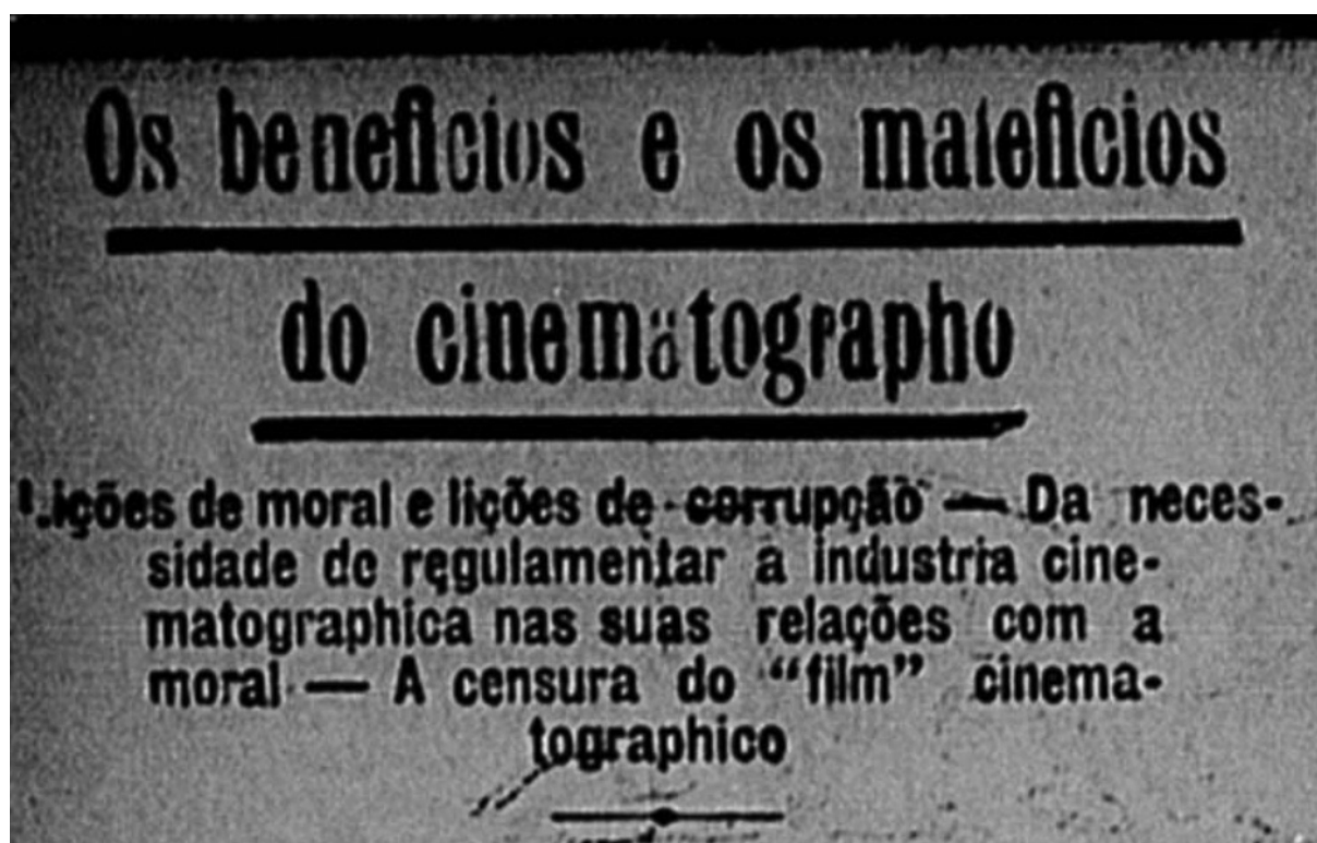
Título do texto do português Carlos Malheiro Dias. Fonte: Jornal do Brasil , Rio de Janeiro, 15 de novembro de 1916, p. 10.

essas liberdades por via jurídica. Ao apresentar seu pensamento, Dias 15 indicava que o Estado teria “o dever de impedir por todos os meios legais ao seu alcance a deterioração moral da sociedade, produzida pelo estímulo público e diário do cinematographo”. Assim, o cinema deveria passar por uma censura, assim como já ocorria com o teatro.