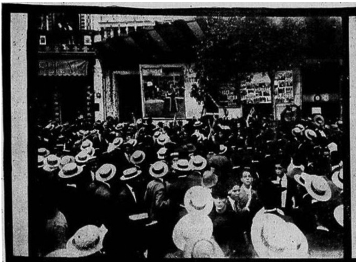
Foto do cinema Parisiense (1913), inaugurado em agosto de 1907.

Também em março de 1907, foi aberta a primeira sala específica para exibições cinematográficas no Rio de Janeiro, o cinema Parisiense. 22 O Parisiense ficava localizado na Avenida Central e seu proprietário era o empresário Jácomo Rosário Staffa. 23 Em pouco tempo, várias salas foram inauguradas no centro carioca e, posteriormente, nos subúrbios da cidade. 24