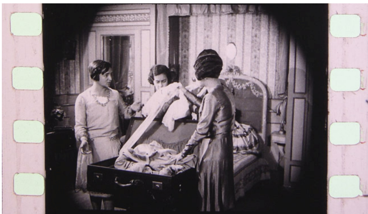
Fotograma de Del pingo al volante (Robert Kouri, 1929)

1920-1930). 19 Desde este punto de vista, el proyecto ha permitido aportar imágenes en movimiento de un período de la historia del país con escasos registros de memoria visual. Estos films, junto a Partido del Club Nacional de Fútbol contra el Génova Cricquet y Fútbol Club en Génova ” (Uruguay-Italia, 1925) 20 han sido objeto de producciones cinematográficas contemporáneas, permitiendo así una nueva puesta en circulación y contribuyendo, de este modo, a los intereses de difusión de la CU y del ICAU.