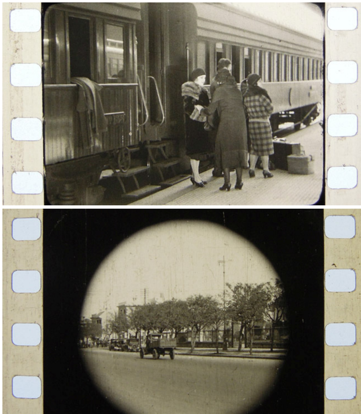
Fotogramas de Del pingo al volante (Robert Kouri, 1929)

La puesta en marcha de estas primeras fases del plan contaron con el apoyo del Grupo de Estudios Audiovisuales (GEstA) que, en el año 2009, instituyó por primera vez en Uruguay un espacio universitario especializado en los estudios académicos sobre cine local, situado en el ámbito del Espacio Interdisciplinario de la Universidad de la